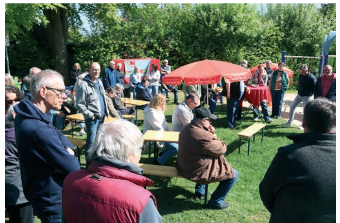
Auf dem Spielplatz an der Oststraße suchten Anlieger, Vertreter der SPD und des Ordnungsamtes nach Lösungen für die Parkplatznöte.

Joachim Fuchsberger, Schauspieler (1927 bis 2014)