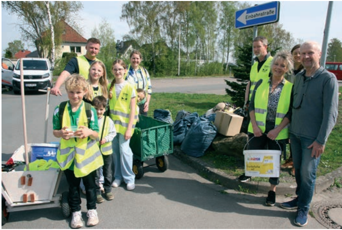
Alle Altersgruppen beteiligten sich an der Müllsammlung.

Ob nun Müllsammlung, Bergstadt-Putz oder Clean up Day – gemeint ist stets dasselbe. Auf das Ergebnis kommt es an, und das kann sich wahrlich sehen lassen: Helpup ist nach der gemeinsamen Reinigungsaktion wieder müllfrei. Die Aktion hatte der Verkehrs- und Verschönerungsverein Helpup (VVV) organisiert.