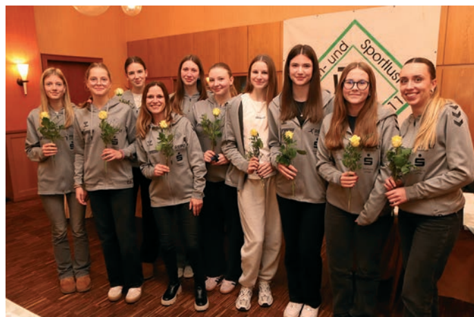
Auch Deutsche Meister – hier die Schülermannschaft im Korbball – befinden sich unter den Mitgliedern der TuS Helpup.