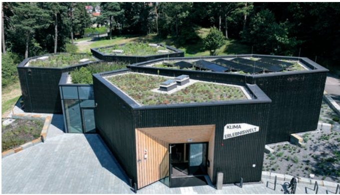
Die Klimaerlebniswelt in Oerlinghausen wurde mit dem Red Dot Design Award ausgezeichnet.