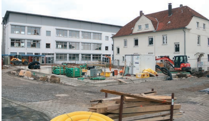
Das alte Gebäude (hinten) für den Offenen Ganztagsunterricht soll ersetzt werden.

Die Arbeiten an der Grundschule in Helpup gehen planmäßig voran. Dies berichtete Architekt Falko Biermann in der jüngsten Sitzung des Bauausschusses. Die Fortschritte sind bereits erkennbar: Nachdem der Verwaltungstrakt bereits im vergangenen Jahr abgerissen wurde, ist an der Stelle jetzt die Bodenplatte für das neue zweigeschossige Gebäude fertiggestellt. Hier werden Aula und Mensa sowie im Obergeschoss die Verwaltungsräume Platz finden. Biermann bezifferte die Kosten mit drei Millionen Euro. Für den Ausbau des Altbaus wird eine weitere Million im Haushaltsplan bereitgestellt. Als notwendig erachtet Biermann auch den Abriss des OGS-Gebäudes. Eine Sanierung wäre zu kostspielig, erklärte er. Für das neue Gebäude werden 2,5 Millionen Euro veranschlagt, davon kommen 600.000 Euro als Förderung vom Land NRW. Der Neubau soll im Jahr 2027 fertiggestellt sein.