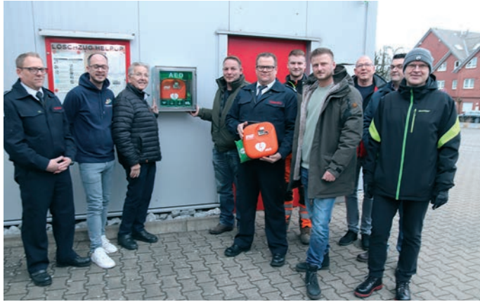
Vertreter der Freiwilligen Feuerwehr und die Sponsoren stellen den Defibrillator vor.