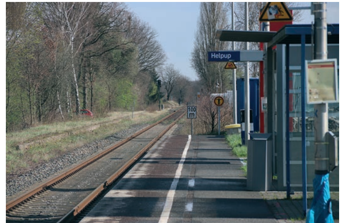
Es fährt kein Zug nach Irgendwo . . .

In Richtung Politik fragte die IHK Lippe, warum nicht längst gegen-gesteuert wurde. Das gelte nicht nur für notleidende Verkehrsunternehmen, sondern auch für die gesamte Infrastruktur und das Material. In Deutschland sei jahrelang auf Verschleiß gefahren worden. Strecken, Technik und Züge seien bei weitem nicht auf dem neuesten Stand, kritisiert die IHK. Und der Versuch, das ganze System auch