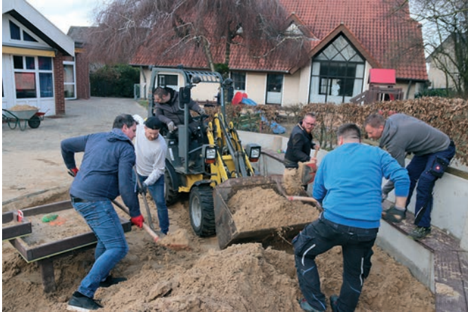
Die Väter der Kita-Kinder haben fast 60 Tonnen Sand bewegt.

„Frühjahrsputz“ mal anders im Ev. Familienzentrum Auf der Brede: Die Kita ist in die Jahre gekommen. Daher entschlossen sich das Kita Team, die Eltern und die Mitglieder des Fördervereins, selbst aktiv zu werden. An zwei Tagen griffen sie zu Schaufeln, Schubkarren, Pinseln und Farbe.