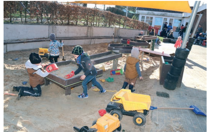
Anschließend hatten die Kleinen wieder viel Spaß beim Spielen.

Jetzt wirkt die Kita wieder frisch und ansehnlich, fast wie neu. Kaum zu glauben, dass das Gebäude schon 50 Jahre alt ist. Im September soll das Jubiläum gefeiert werden. Das äußere Erscheinungsbild ist jetzt schon darauf vorbereitet.