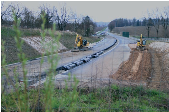
Wie Straßen.NRW mitteilt, beginnen in Asemissen die letzten Arbeiten zum Ausbau der Bundesstraße 66. Die neue Fahrbahndecke ist bereits aufgebracht.

Vor dem Neubau herrschte ganztägig „Rushhour“ an der Kreuzung Detmolder Straße/Hauptstraße/Tunnelstraße. 20.000 Fahrzeuge nutzen die Bundesstraße täglich, dazu kommen etwa 13.000 Fahrzeuge auf den querenden Straßen. Die Bestandstraße konnte diese Verkehrsmengen nicht mehr aufnehmen und abwickeln. Auf einer Länge von 2,1 Kilometern wird der Bereich seit Herbst 2020 ausgebaut. Künftig wird es dort keine Ampeln mehr geben. An der „Roller-Kreuzung“ führt in Zukunft eine Brücke über die neue Trasse der Bundesstraße. Kreisler leiten dann auf beiden Seiten der neuen B 66 auf diese Brücke oder von ihr herunter.