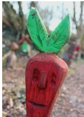
Am Ostersonntag können Kinder in „Wichtelhausen“ nach Eiern suchen.